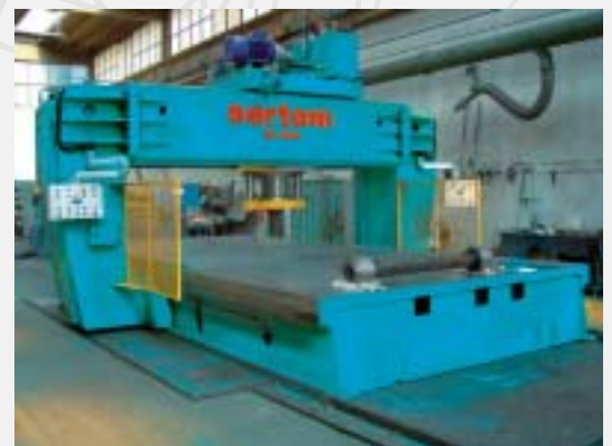
Gantry press 400tx3500x8000 Pressa a portale 400tx3500x8000