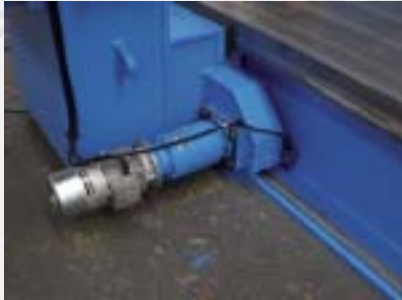
Gantry movement Movimento portale