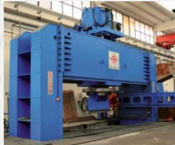
P2MM 1000 Ton x 6500 mm