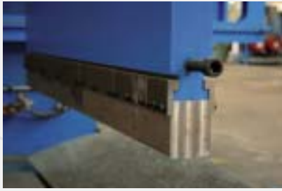
Different dies Differenti stampi